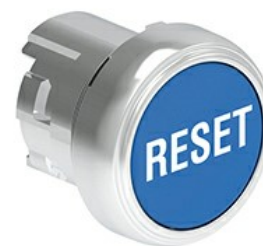
Butoane de impuls cu simboluri LPSB11