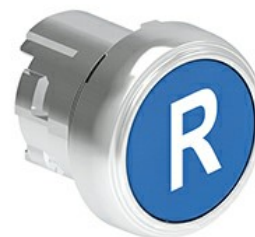
Butoane de impuls cu simboluri LPSB11