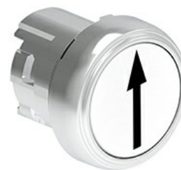
Butoane de impuls cu simboluri LPSB11