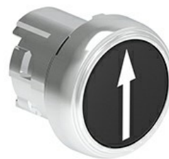
Butoane de impuls cu simboluri LPSB11