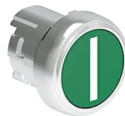
Butoane de impuls cu simboluri LPSB11