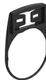
Suport etichetă LPFXAU100

Denumirea produsului Denumirea tipului de produs