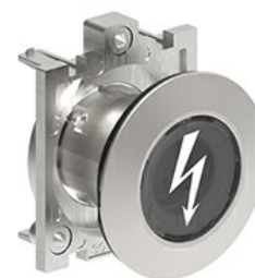
Cap de lumină pilot LPFL