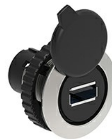
Interfață USB, conexiune tip A/B mamă LPFD0