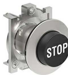
Butoane de impuls cu simboluri LPFB21