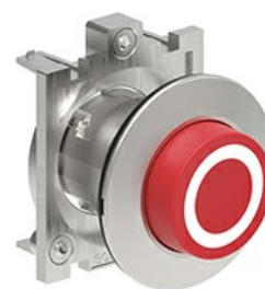
Butoane de impuls cu simboluri LPFB21