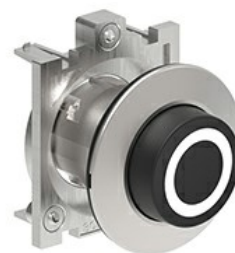
Butoane de impuls cu simboluri LPFB21