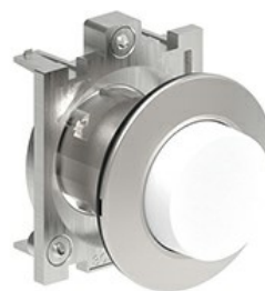
Buton cu puls pulsatoriu LPFB20