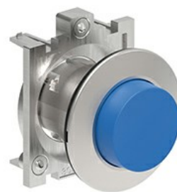
Buton cu puls pulsatoriu LPFB20