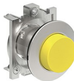
Buton cu puls pulsatoriu LPFB20