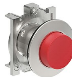
Buton cu puls pulsatoriu LPFB20