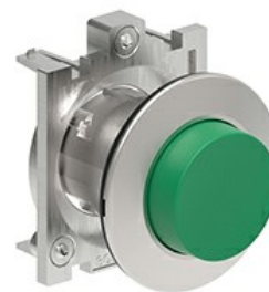
Buton cu puls pulsatoriu LPFB20