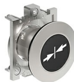
Butoane de impuls cu simboluri LPFB15