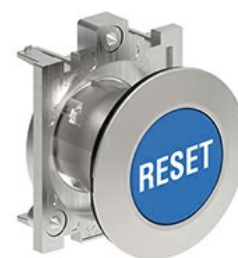
Butoane de impuls cu simboluri LPFB11