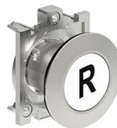
Butoane de impuls cu simboluri LPFB11