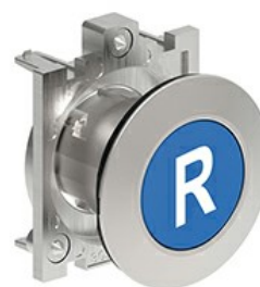
Butoane de impuls cu simboluri LPFB11