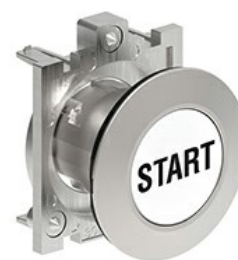
Butoane de impuls cu simboluri LPFB11