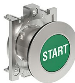
Butoane de impuls cu simboluri LPFB11