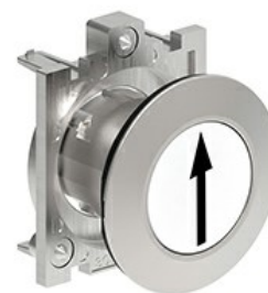
Butoane de impuls cu simboluri LPFB11