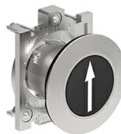
Butoane de impuls cu simboluri LPFB11