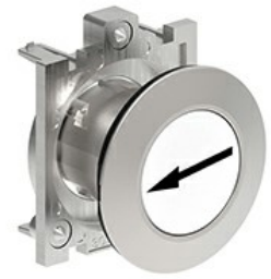
Butoane de impuls cu simboluri LPFB11