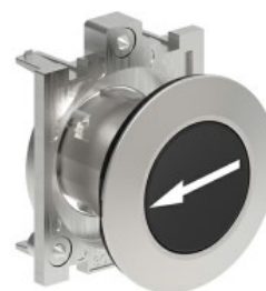
Butoane de impuls cu simboluri LPFB11