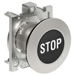
Butoane de impuls cu simboluri LPFB11