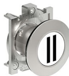
Butoane de impuls cu simboluri LPFB11