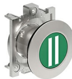
Butoane de impuls cu simboluri LPFB11