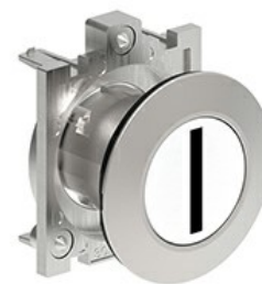
Butoane de impuls cu simboluri LPFB11