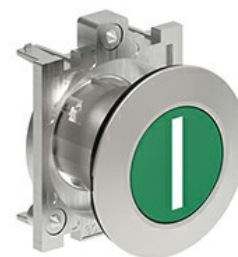
Butoane de impuls cu simboluri LPFB11