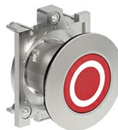
Butoane de impuls cu simboluri LPFB11