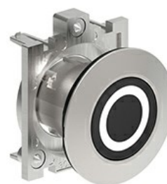
Butoane de impuls cu simboluri LPFB11