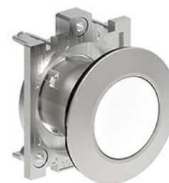
Buton cu puls pulsatoriu LPFB10