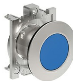
Buton cu puls pulsatoriu LPFB10