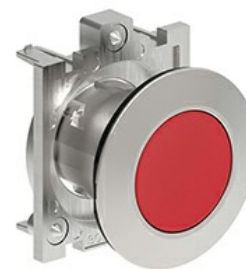
Buton cu puls pulsatoriu LPFB10