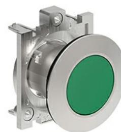
Buton cu puls pulsatoriu LPFB10