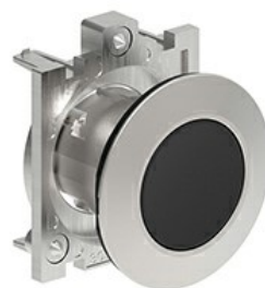
Buton cu puls pulsatoriu LPFB10