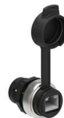
Interfata RJ45, conexiune Ethernet cu cablu de 1m lungime LPCD0 Cat.5E