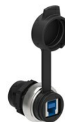
Interfață USB, conexiune tip B/A mamă LPCD0