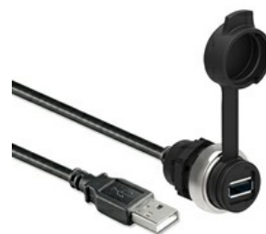
Interfață USB, conexiune tip A/A mamă cu cablu de 1 m lungime LPCD0