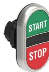
Buton cu dublă atingere, revenire cu arc - două butoane de apăsare LPCB71