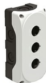
Plastikowa obudowa bez wyposażenia - 3 otwory LPZP3A8