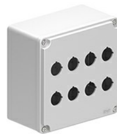
Obudowy z otworami \varnothing 22mm – wielotworowa na 8 przycisków LPZM