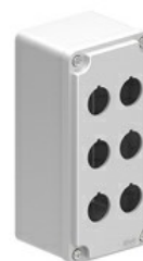
Obudowy z otworami Ø 22mm – wielootworowa na 6 przycisków LPZM