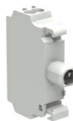
Źródło światła LED, światło ciągłe, zaciski sprężynowe LPXLP