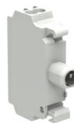
Źródło światła LED, światło ciągłe, zaciski sprężynowe LPXLP