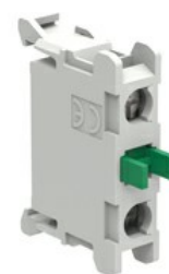
Zestyki montowane na tylnej pokrywie obudowy LPZ LPXCB