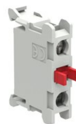
Zestyki montowane na tylnej pokrywie obudowy LPZ LPXCB