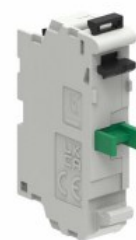
Zestyki – bez adaptera montażowego LPXC